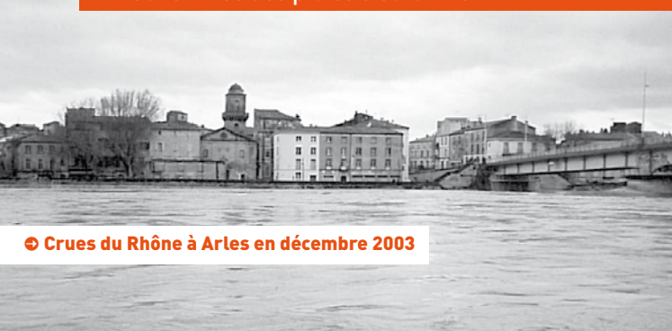
☛ Crues du Rhône à Arles en décembre 2003