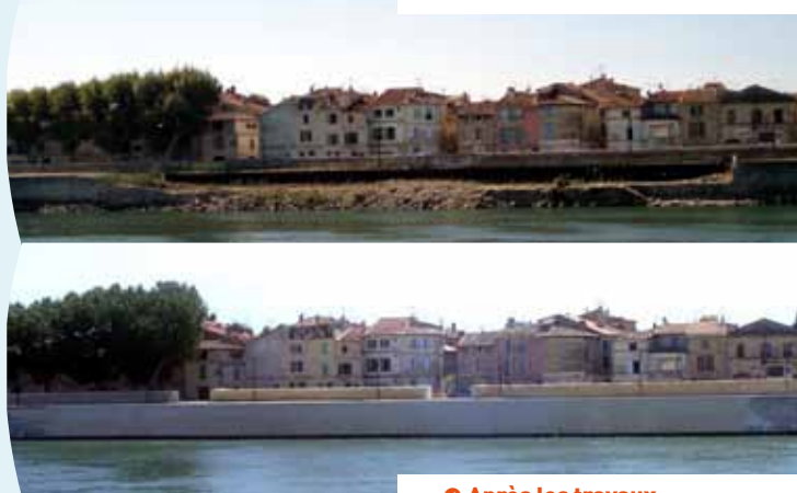
☛ Après les travaux...